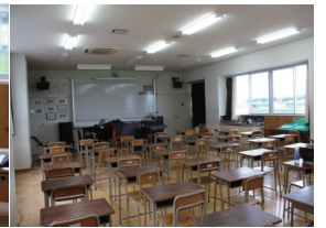
音楽部の部活動公開