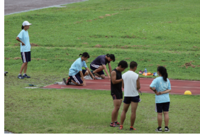
校庭など各所で行われた運動部の部活公開