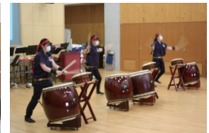
吹奏楽部と和太鼓部の演奏