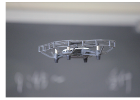
F.C.ラボのドローン実験