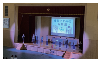
第一体育館での生徒主体の学校概要説明