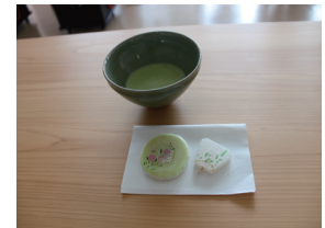
茶道部のお点前(おてまえ)