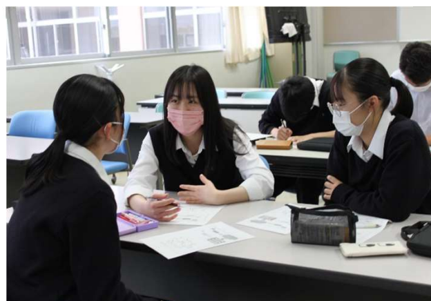
課題に問いを重ねて新たな課題を発見!!