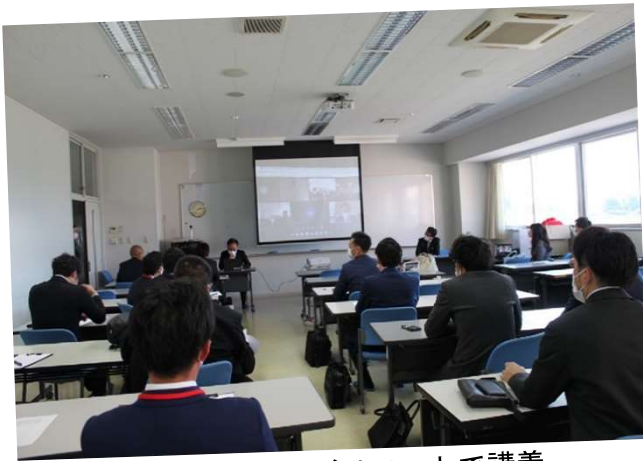
青年会議所の方がリモートで講義