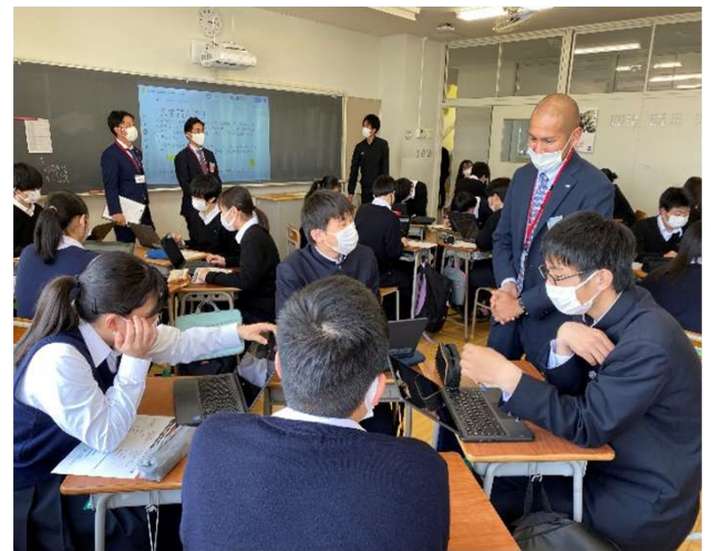
意見交換しながらのグループワーク