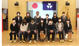
入学式での集合写真