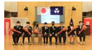
卒業式での集合写真