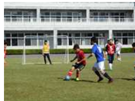
部活動の活躍 サッカー部