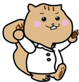
藤中理数科マスコットキャラクター『りすたん』

8月9日(金)にオープンスクールを実施します!! 授業体験や部活動見学など藤岡中央高校を知ってもらうための様々な企画を準備しています。中学校を通して申込みを受け付けていますので参加希望の方は中学校の先生に相談してください。申込みは7月12日(金)まで受け付けています。