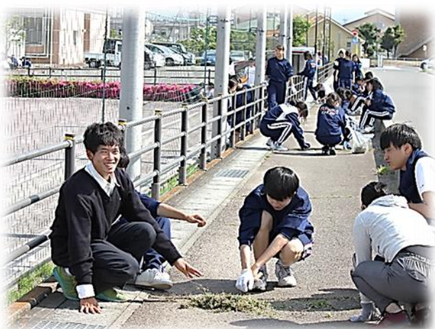
地域の清掃活動に取り組む生徒たち