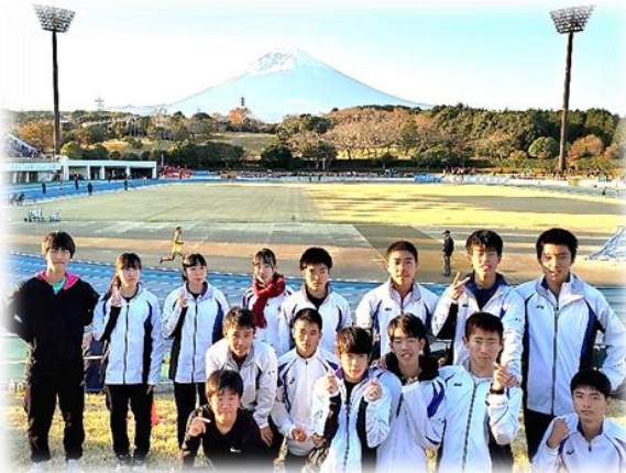
富士山を望む大会会場での陸上競技部員

10月27日（日）に伊勢崎市で開催された県高等学校総合体育大会駅伝競走の部で男子が6位に入賞し、11月16日（土）に静岡県で開催された関東大会に出場しました。