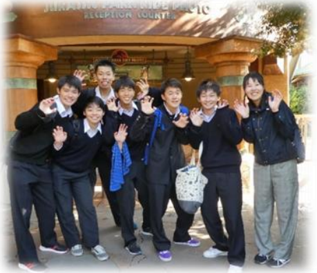
ユニバーサルスタジオジャパンにて

11月19日(火)から22日(金)にかけて2学年が修学旅行に行ってきました。1日目は飛行機、バス、フェリーを乗り継いで広島県の宮島へ。晴天に恵まれ、美しい海と厳島神社を観光す。2日目は待ちに待ったユニバーサルスタジオジャパン。仲のよい友人たちとアトラクションに乗ったり買い物したりして、思い出に残る一日になったようです。満面の笑みでパーク内を巡る生徒たちの姿が印象的でした。3日目は待ちに待ったユニバーサルスタジオ大阪市内観光を楽しみました。午後は大阪へ移動し班ごとに大阪城や道頓堀など大阪市内観光を楽しみました。