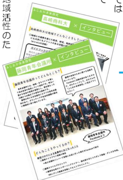
連携先からいただいたメッセージ

今年度、3年生の総合の時間では『ふじおか未来探究』を実施しています。藤岡市の課題を見つけ、課題を解決するためのアイデアを提案・発表する予定です。また、藤岡市役所、藤岡区長会、藤岡青年会議所、高崎商科大学と連携し、藤岡市の現状や地域活性化のための活動についてアドバイスをいただいています。