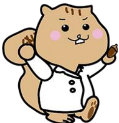
藤中マスコットキャラクター 『りすたん』

また、藤岡中央高校ホームページには、当日の日程と活動予定の部活動が掲載されています。こちらをご覧ください。