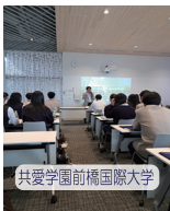
共愛学園前橋国際大学