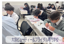
大宮ビューティー&ブライダル専門学校