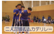
二人三脚&ムカデリレー