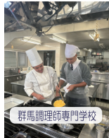
群馬調理師専門学校