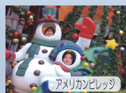
アメリカンビレッジ