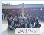
おきなわワールド