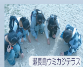
瀬長島ウミカジテラス