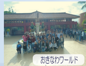
おきなわワールド