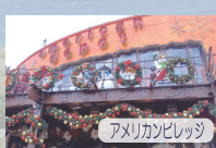
アメリカンビレッジ