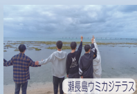
瀬長島ウミカジテラス