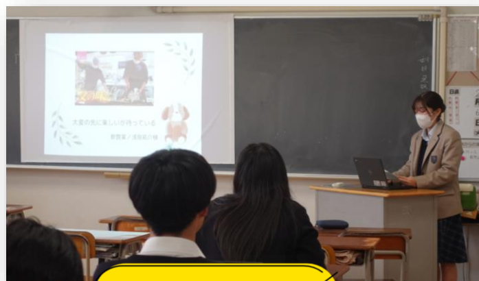
きやりあ未来探究