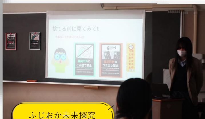
ふじおか未来探究