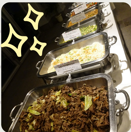
夜もビュッフェを堪能♪