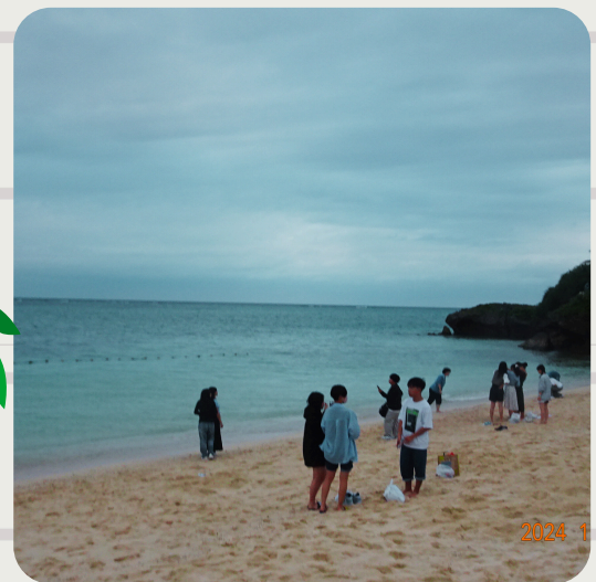
ビーチで遊んだよ。