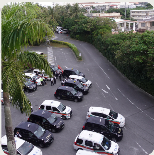
今日はタクシー見学。