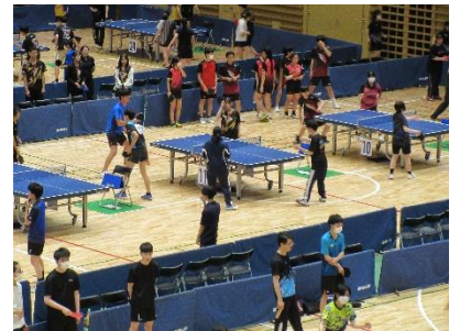
全国大会のようす ↑卓球 ↓パドミントン